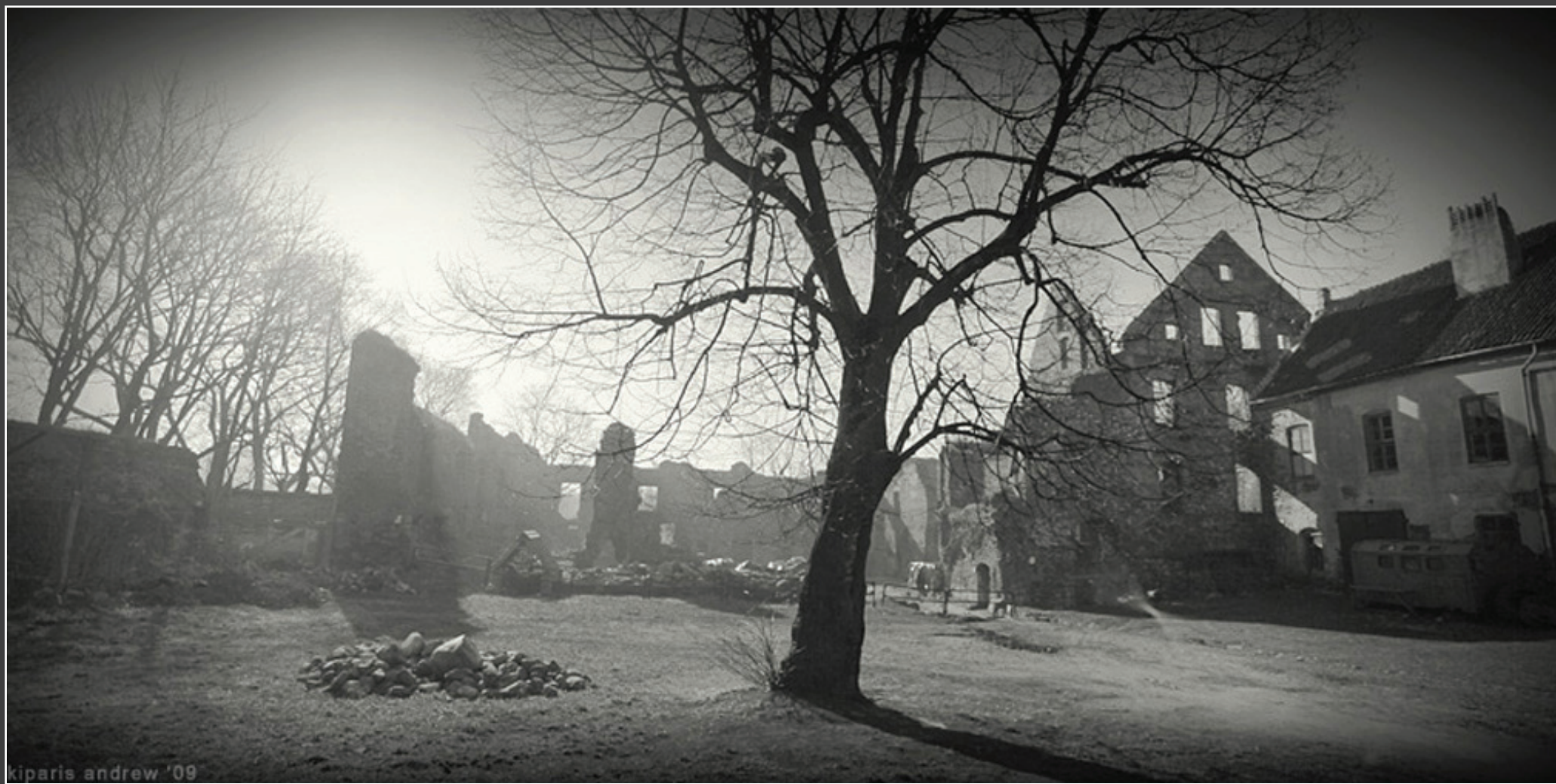
kiparis andrew '09